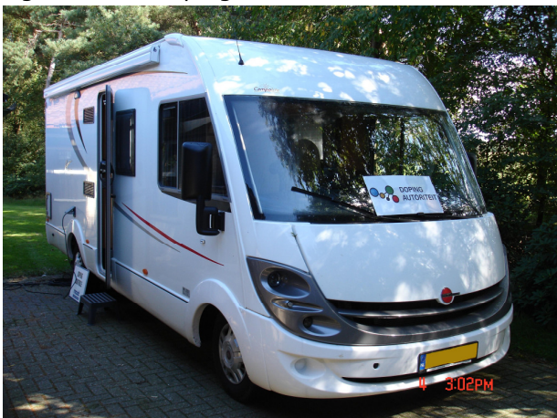
Fig. 3 Mobiel dopingcontrolestation